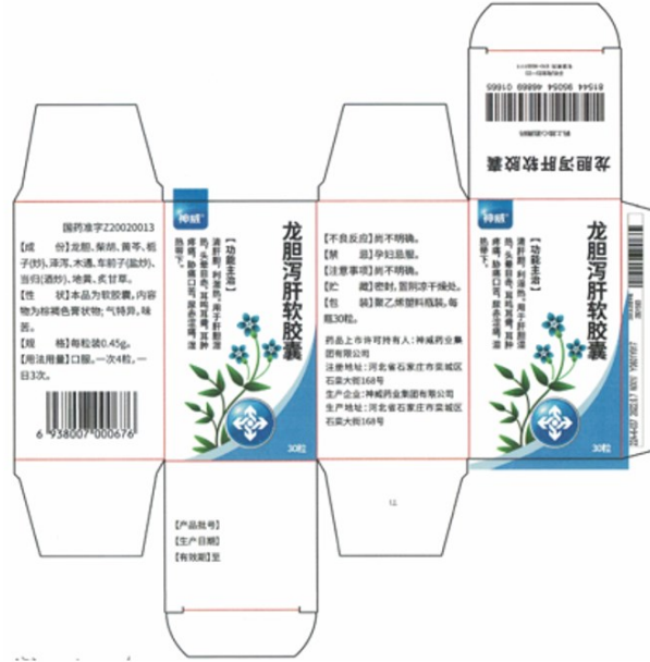
瓶装或软管装产品对插盒