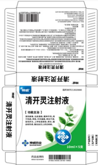
注射液产品机粘盒