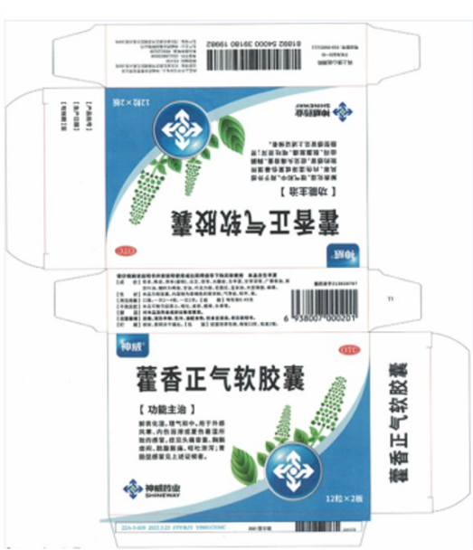
条包产品、铝塑板装产品对插盒