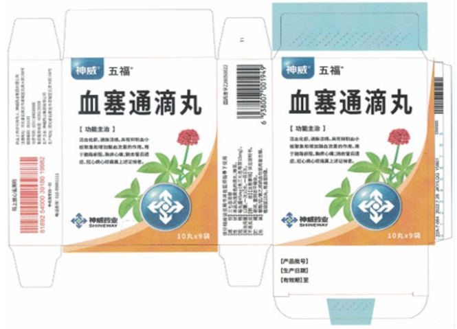
滴丸剂产品机粘盒